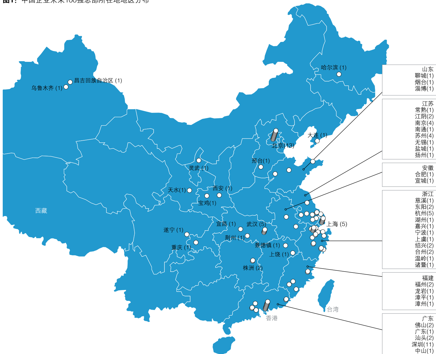
图1: 中国企业未来100强总部所在地地区分布

这些企业遍布中国各地,但仍以位于各大主要城市为多——特别是北京、上海、深圳和武汉(表1和图1)。100强企业广泛地遍布于中国各地。很多公司将总部设在大城市或东部沿海,这体现了这些区域的经济水平。但是我们也注意到,新兴全球巨头的分布有向南转移的趋势。2014年的榜单中,七家企业的总部设在深圳,而2016年达到了11家;同时,总部位于北京的企业从17家减少为13家。这反映出,由于同香港和全球经济密切相关、具备前海等国家级开放平台、高新科技产业发展资源,深圳的经济地位正在不断提升。